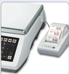
프린터 연결 기능