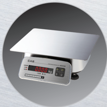
▲ Large Tray