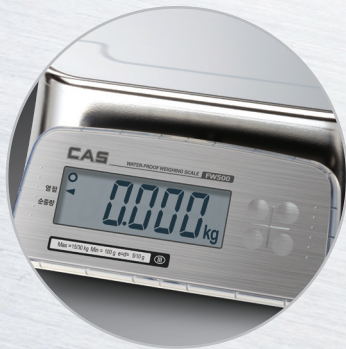
▲ Rear Display