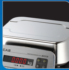
Stainless steel 짐판